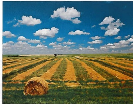
34 Les Grandes Plaines canadiennes s'étendent entre le Bouclier canadien et les montagnes Rocheuses.