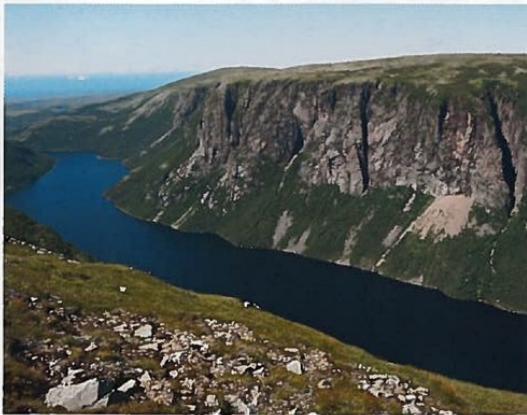
33 Un plateau séparé par une vallée glaciaire dans le parc national du Gros-Morne au Labrador.

Plaine Grande étendue de terrain plate située à basse altitude.